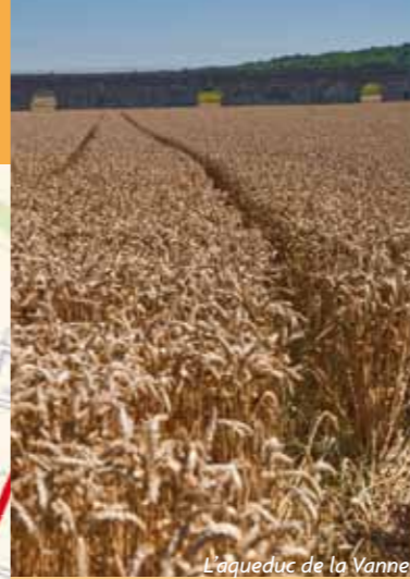
L'aqueduc de la Vanne